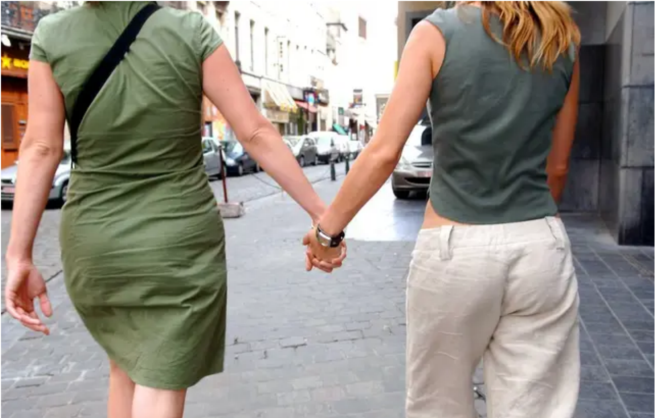
Illustration d'un couple de femmes main dans la main.

Hakima Bounemoura | Publié le 06/10/19 à 18h22 — Mis à jour le 07/10/19 à 15h45